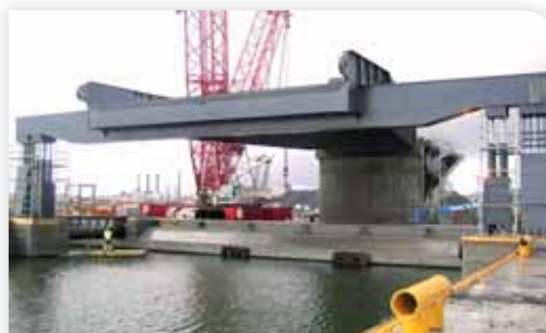
Монтаж, Весна 2008.