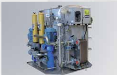
Модульная Fluid Circ Система Смазки