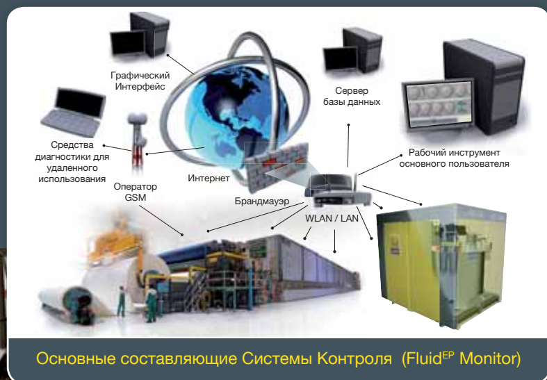
Основные составляющие Системы Контроля (Fluid EP Monitor)