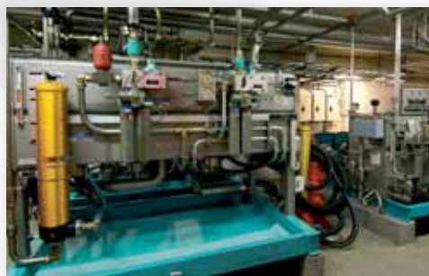
Гидравлическая Силовая Установка