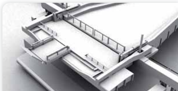
Моделирование и воспроизведение на этапе проектирования, Весна 2007.